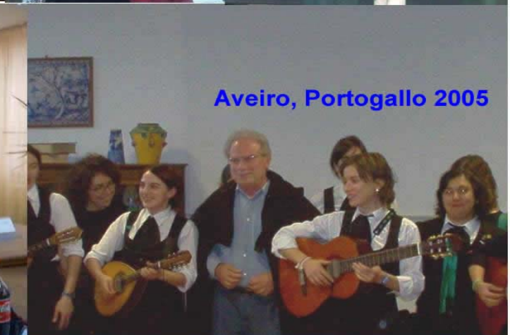
Aveiro, Portogallo 2005