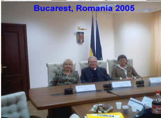
Bucarest, Romania 2005