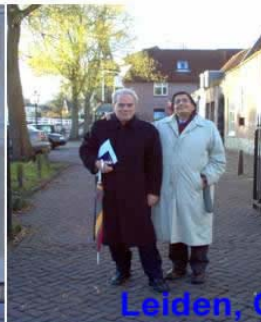
Leiden, Olanda 2004