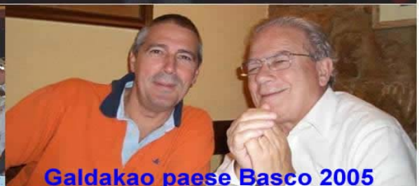
Galdakao paese Basco 2005