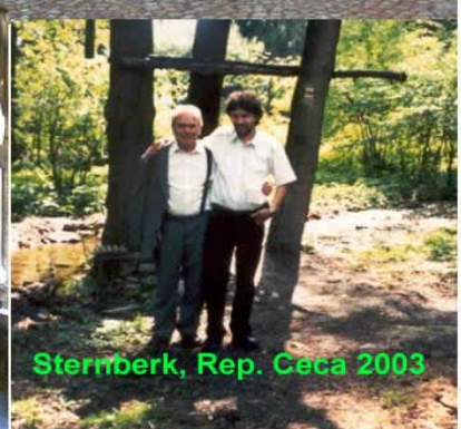
Sternberk, Rep. Ceca 2003