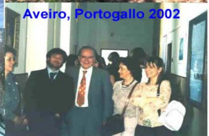
Aveiro, Portogallo 2002