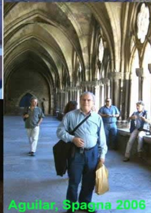
Aguilan, Spagna 2006