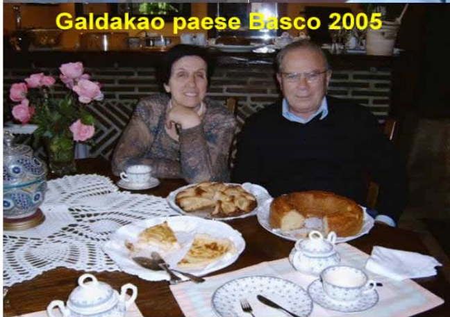
Galdakao paese Basco 2005