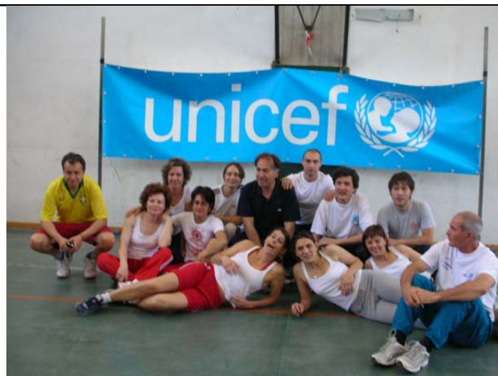
Alcuni insegnanti del Liceo, protagonisti di una partita di pallavolo a favore dell'UNICEF